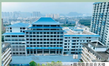
▼ 图书信息综合大楼