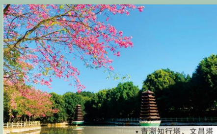
▼ 青湖知行塔、文昌塔