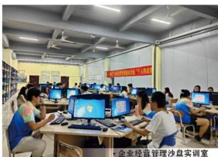
▼ 企业经营管理沙盘实训室