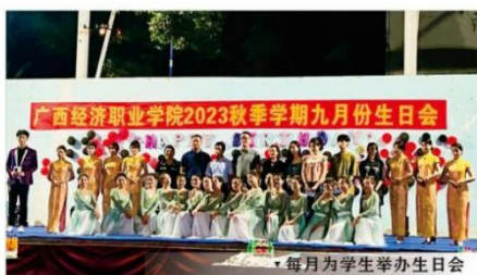
▼ 每月为学生举办生日会